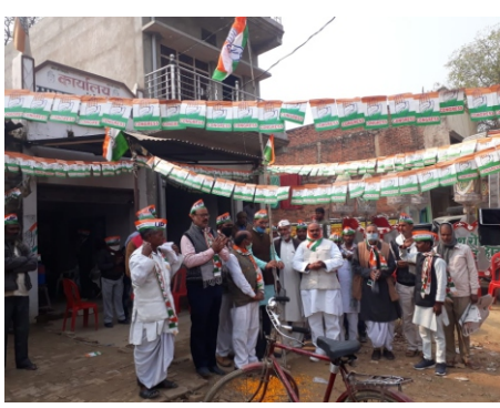
कांग्रेसियों ने मनाया 136 वा स्थापना दिवस

प्रखर केराकत जौनपुर। अखिल भारतीय कांग्रेस पार्टी का 136 वाँ स्थापना दिवस केराकत सिहाली स्थित