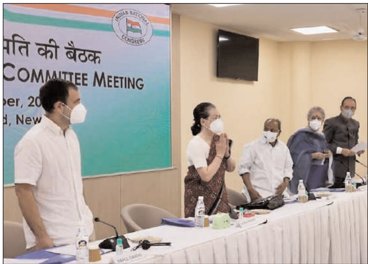
कांग्रेस के अध्यक्ष सोनिया गांधी ने कहा कि हमें सोनिया गांधी जी पर पूरा भरोसा है और कोई भी उनके नेतृत्व पर सवाल नहीं उठा रहा है।

नई दिल्ली। अक्टूबर में कांग्रेस पार्टी को अपना नया अध्यक्ष मिलेगा जाएगा। सूत्रों के अनुसार कांग्रेस अध्यक्ष के चुनाव सितंबर में होंगे। कांग्रेस नेता गुलाम नबी आजाद ने सीडब्ल्यूसी की बैठक के दौरान कहा कि हमें सोनिया गांधी जी पर पूरा भरोसा है और कोई भी उनके नेतृत्व पर सवाल नहीं उठा रहा है। वहीं, कार्यसमिति की बैठक में पार्टी के असंतुष्ट नेताओं को जवाब देते हुए पार्टी की अंतरिम अध्यक्ष सोनिया गांधी ने कहा कि मैंने हमेशा स्पष्टता की सराहना की है। मीडिया के माध्यम से मुझसे बात करने की कोई जरूरत नहीं है। अपने उद्घाटन भाषण में सोनिया गांधी ने कहा कि पूरा संगठन कांग्रेस को पुनर्जीवित करना चाहता है, लेकिन इसके लिए एकता और पार्टी के हितों को सर्वोपरि रखने की जरूरत है। सबसे बढ़कर, इसके लिए आत्म-नियंत्रण और अनुशासन की आवश्यकता होती है। कार्यसमिति की बैठक में पार्टी अध्यक्ष समेत संगठन चुनाव कराने की प्रक्रिया शुरू करने का फैसला लिया जा सकता है। इस बैठक में कांग्रेस की अंतरिम अध्यक्ष सोनिया गांधी, राहुल गांधी और कांग्रेस महासचिव प्रियंका गांधी वाड्ढा मौजूद हैं। अपने उद्घाटन भाषण में कांग्रेस की अंतरिम अध्यक्ष सोनिया गांधी ने कहा कि पूरा संगठन कांग्रेस को पुनर्जीवित करना चाहता है, लेकिन इसके लिए एकता और पार्टी के हितों को सर्वोपरि रखने की जरूरत है। सबसे बढ़कर, इसके लिए आत्म-नियंत्रण और अनुशासन की आवश्यकता होती है। बैठक में आगामी विधानसभा चुनाव और लखीमपुर खीरी