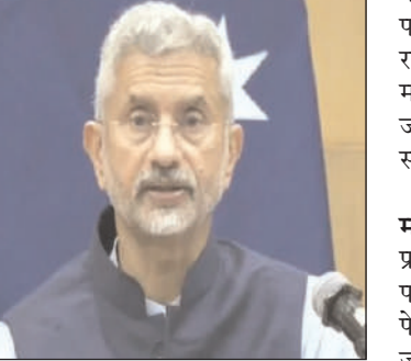
जयशंकर की यात्रा से पहले इस्त्राइल ने भारत को बताया सबसे करीबी मित्र, क्या पेगासस पर होगी चर्चा?