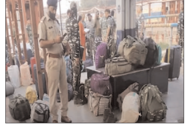
एक डिब्बे की फर्श पर गिर गया। रायपुर पुलिस ने बताया कि सीआरपीएफ की 211 बटालियन के जवान जम्मू से स्पेशल ट्रेन में जा रहे थे। उनके साथ में ग्रेनेड रखे थे, जो कि बक्से में बंद कर रखे गए थे। घटना में चार लोगों को मामूली चोटें आई हैं। एक को निजी अस्पताल ले जाया गया, जहाँ उसका उपचार जारी है, जबकि तीन अन्य प्राथमिक उपचार के बाद सीआरपीएफ ट्रेन से ही रहाना हो गए।