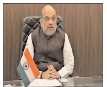
एनएसजी की स्थापना की 37वीं वर्षगांठ है। एनएसजी को ब्लैक कैट्स के नाम से भी जाना जाता है।