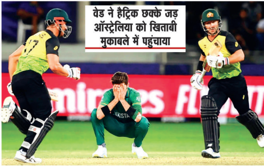
वेड ने हैट्रिक छक्के जड़ ऑस्ट्रेलिया को खिताबी मुकाबले में पहुंचाया

स्टोइनिस ने जहां 31 गेंदों पर 2 चौके व 2 छक्के की मदद से 40 रन बनाए, वहीं मैथ्यू वेड ने मात्र 17 गेंदों पर चार छक्के व 2 चौके के साथ 41 रनों की विस्फोटक पारी खेली। दोनों ने ऑस्ट्रेलिया को संकट से उबार। एक समय ऑस्ट्रेलिया 12.2 ओवर में पांच विकेट गंवाकर 96 रन बनाए थे, लेकिन वेड व स्टोइनिस ने आते ही मैच का पांसा पलट दिया। इससे पहले टॉस गंवाकर पहले खेलते हुए पाकिस्तान ने चार विकेट के नुकसान पर 176 रनों का स्कोर बनाया।