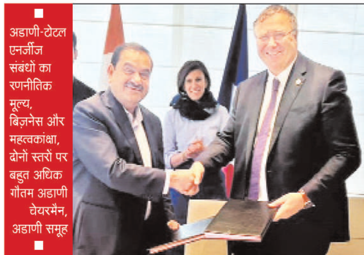
10 वर्षों में ग्रीन हाइड्रोजन और इससे संबंधित इकोसिस्टम के क्षेत्र में 50 बिलियन डॉलर से ज्यादा का निवेश करेगी एनआईएल

क्लीन एनर्जी के मामले में अडाणी व टोटल आगे