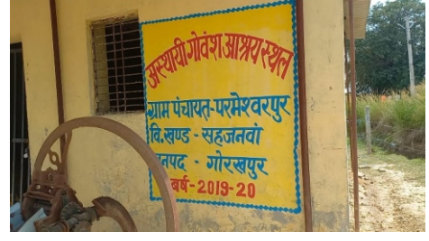
सूत्रों के हवाले से बड़ी खबर

सहजनवा विकास खंड के अन्तर्गत परमेश्वरपुर के गौशाला पर नहीं कराई गई कृष्ण जन्माष्टमी की पूजा