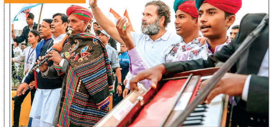
झालावाड़ जिले में कांग्रेस पार्टी की भारत जोड़ो यात्रा के दौरान संगीतकारों के साथ कांग्रेस नेता राहुल गांधी।