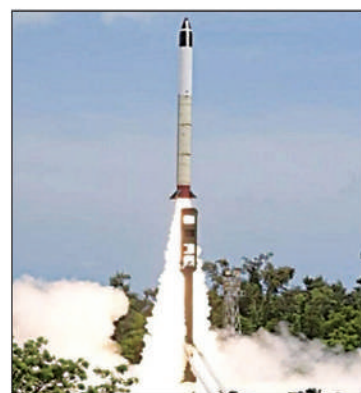
कलाम द्वीप से एचएसटीडीवी का सफल परीक्षण

इस सफल टेस्ट के बाद भारत अब अमेरिका, रूस, चीन के साथ हाइपरसोनिक मिसाइल क्लब में शामिल हो गया है। भारत ने इससे पहले 07 सितम्बर, 20 को सफलतापूर्वक हाइपरसोनिक टेकनोलॉजी डिमॉन्स्ट्रेटर व्हीकल (एचएसटीडीवी) का परीक्षण किया था। स्वदेशी रक्षा तकनीक में एक और महत्वपूर्ण मील का पत्थर साबित