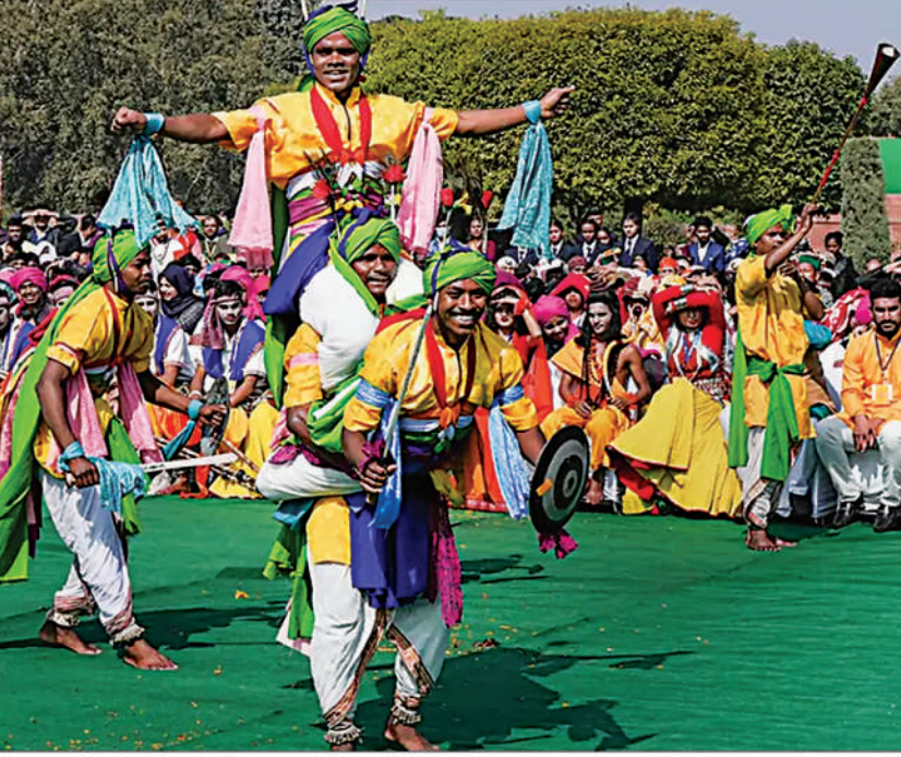
गणतंत्र दिवस परेड 2023 में भाग लेने वाले झांकी कलाकारों ने नई दिल्ली स्थित राष्ट्रपति भवन में राष्ट्रपति द्रौपदी मुर्मू के साथ मुलाकात की। इस दौरान लोक कलाकारों ने पारंपरिक वेशभूषा में रंगारंग प्रस्तुति भी दी।