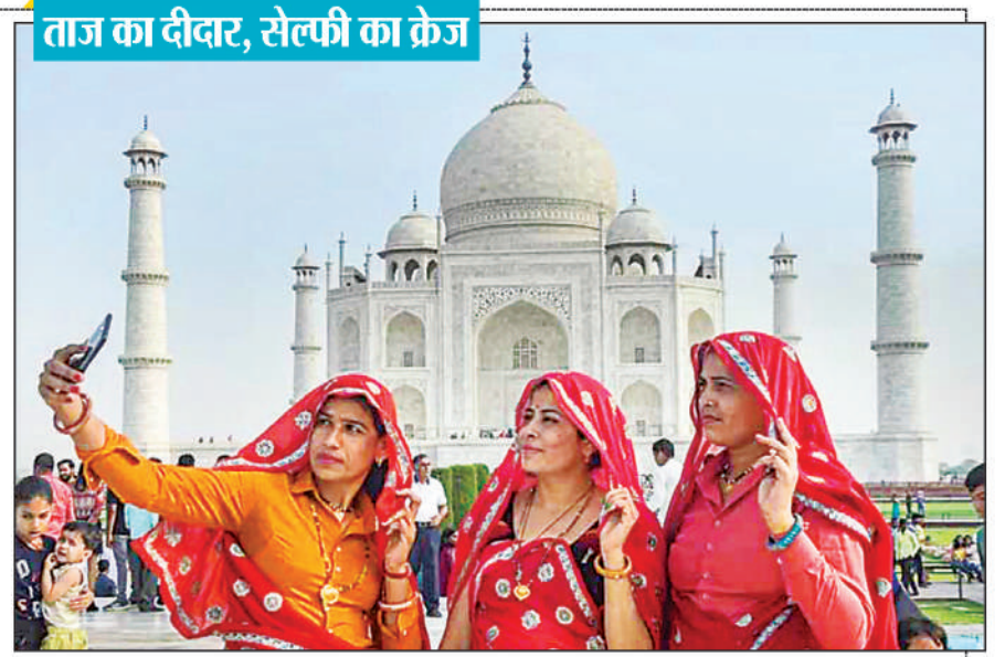
उत्तर प्रदेश के शहर आगरा में रविवार को ताजमहल के सामने सेल्फी लेती महिलाएं। गौरतलब है ताज का दीदार करना हर इंसान का सपना होता है। उसका पूरा होना जीवन का अमूल्य पल बन गया।

की संस्कृति तीन पीढ़ियों तक लगातार चल रही है। अमित शाह ने कहा कि महाराष्ट्र ने देश को तीन परंपराएं दी हैं। यह महान छत्रपति शिवाजी महाराज की पावन भूमि है। राष्ट्र के लिए बलिदान की परंपरा छत्रपति शिवाजी महाराज से शुरू हुई। वीर सावरकर, वासुदेव बलवंत फडके, चाफेकर बंधु और लोकमान्य तिलक जैसे लोगों ने महाराष्ट्र की धरती से देश के लिए अपने प्राणों की आहुति दी। समर्थ रामदास से लेकर तुकाराम महाराज से लेकर नामदेव महाराज तक भक्ति की एक और परंपरा ने हमेशा देश को आगे बढ़ाने का काम किया है। तीसरी परंपरा सामाजिक परिवर्तन की है।