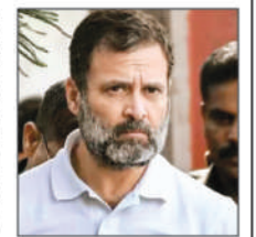
कर्नाटक को 40 प्रतिशत कमीशन वाली भाजपा सरकार से मुक्त कराएगी कांग्रेस

बैंगलूरु, (एजेंसी)। कांग्रेस नेता और घायल से अयोग्य ठहराए गए सांसद राहुल गांधी ने रविवार को कहा कि उनकी पार्टी कर्नाटक को भाजपा सरकार की 40 प्रतिशत कमीशन की सरकार से मुक्त करेगी। श्री गांधी ने अपनी एक फेसबुक पोस्ट पर लिखा कि हम यह सुनिश्चित करेंगे कि कर्नाटक भाजपा सरकार की 40 प्रतिशत कमीशन की सरकार से मुक्त हो। वहीं उन्होंने रविवार को भाजपा सरकार पर अन्य पिछड़ा वर्ग (ओबीसी) के लोगों का अपमान करने का आरोप लगाया और प्रधानमंत्री नरेंद्र मोदी को जाति जनगणना सार्वजनिक करने की चुनौती दी। श्री गांधी कहा कि भाजपा का आरोप है कि मैंने इस देश के ओबीसी का अपमान किया है...दरअसल, संयुक्त प्रगतिशील (यूपीए) के सत्ता में रहने के दौरान जातिगत जनगणना की गई थी, लेकिन भाजपा ने सत्ता में आने के बाद डेटा छुपा लिया। आज भाजपा को केंद्र सरकार में अजा-जजा (एससी, एसटी) और ओबीसी का प्रतिनिधित्व केवल सात फीसदी है। उन्होंने यहां जाय भगत 'रेली को संबोधित करते हुए कहा कि अगर जाति जनगणना रिपोर्ट सामने आती है, तो यह स्पष्ट हो जाएगा कि ओबीसी का अपमान कौन कर रहा है।