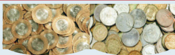
साल में कितने सिक्के बनते हैं? आरबीआई पूरे साल में कितने सिक्के दालेगी, यह सरकार द्वारा तय किया जाता है। इसके अलावा मूल्य के सिक्कों और उसके डिजाइन तैयार करने की भी जिम्मेदारी सरकार की होती है। साधारण तौर पर कड़ संकलन के सिक्के इस्तेमाल कर रहे हैं, उसकी रूपरेखा सरकार ने तय की है।

आप कितने भी पैसों के सिक्के अपने बैंक अकाउंट में जमा कर सकते हैं। सिक्के जमा करने पर किसी भी तरह की कोई सीमा नहीं है। मान लीजिए, आपके पास एक लाख रूपए के सिक्के हैं तो आप उन्हें सिक्के की बैंक में जमा करवा सकते हैं। अगर कोई बैंक सिक्के लेने से मना करता है, तब आप उसकी शिकायत कर सकते हैं।