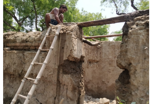
टूटे फूटे मिट्टी के मकान में रहने को मजदूर गरीब परिवार