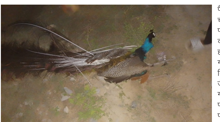
प्रखर केराकत जौनपुर। आपको बता दें कि केराकत

तहसील क्षेत्र के अंतर्गत गंगोली रेलवे स्टेशन के पास जौनपुर से औडीहार की तरफ जा रही