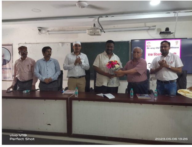
इंजीनियरिंग संस्थान में राष्ट्र निर्माण में युवाओं की भूमिका पर हुई संगोष्ठी

प्रखर जौनपुर। वीर बहादुर सिंह पूर्वांचल विश्वविद्यालय के इंजीनियरिंग संस्थान के विश्वसरेया संगोष्ठी हाल में शनिवार को राष्ट्र भारतीय युवा ही हैं। इसका निर्माण में युवाओं की भूमिका विषयक एक