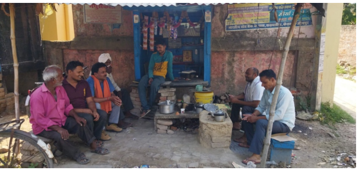
प्रखर केराकत जौनपुर। नगर निकाय चुनाव के पहले चरण के मतदान के बाद अब चौक चौराहों पर चुनाव जीतने को लेकर गहमागहमी तेज हो गई है। कयास के आधार पर लोग अपने-अपने प्रत्याशियों की जीत चौक पर ही कर रहे हैं। इसके पीछे कोई जातीय तो कोई दलीय समीकरण को जीतता बता रहा है। यह अलग बात है

कि अभी भी सेहरा किसके सिर पर बंधेगा? यह तो आने वाले 13 मई को मालूम हो जायेगा मगर राजनीतिक गलियारे में कयासों का दौर शुरु हो गया है। इसी कड़ी में केराकत नगर निकाय चुनाव में अपनी-अपनी किस्मत आजमाने वाले दस नगर अध्यक्ष व 61 सभासद प्रत्याशियों की किस्मत