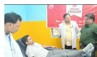
जिलाधिकारी की अपील आप स्वस्थ हैं तो छह माह में एकबार करें रक्तदान

प्रखर भदोही। भदोही जिलाधिकारी गौरांग राठी ने बुधवार को विश्व रक्तदान दिवस पर जिला अस्पताल स्थित ब्लड बैंक पहुंचकर रक्तदान किया। इस दौरान उन्होंने कहा कि आपके रक्त की एक-एक बूंद दूसरे को जीवन दे सकती है। अगर आप स्वस्थ और निरोगी हैं तो रक्तदान करें। दूसरे की जिंदगी बचाना सबसे पुण्य का कार्य है। जिलाधिकारी गौरांग राठी ने रक्तदान के बाद लोगों को संबोधित करते हुए कहा कि 14 जून को दुनिया भर में विश्व रक्तदान दिवस मनाया जाता है। जनपद में विभिन्न