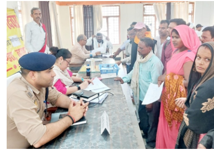
पिंडरा में आये 103, निस्तारण 3

प्रखर पिंडरा वाराणसी। पिंडरा तहसील के सभागार में आयोजित सम्पूर्ण समाधान दिवस पर तपती धूप भी फरियादियों को नहीं रोक पाई और न्याय के लिए अधिकारियों से फरियाद करते नजर आए। लेकिन उन्हें इस बार भी आश्वासन ही मिला। पिंडरा तहसील में एसडीएम पिंडरा अंशिका