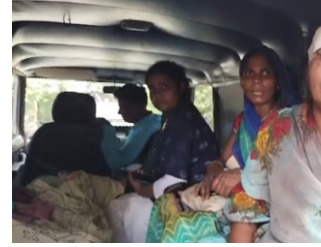
कोरापट्टी में हुए मारपीट के तीन हुए घायल; प्राथमिक स्वास्थ्य केंद्र करजाकला का मामला