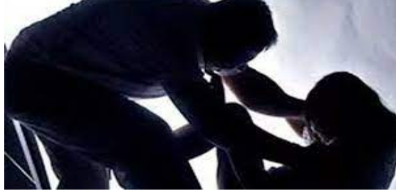
मुकदमा दर्ज होते ही गिरफ्तारी में जुटी पुलिस

जान से मारने की मिल रही धमकी, दबंगों के खौफ से सहमा परिवार