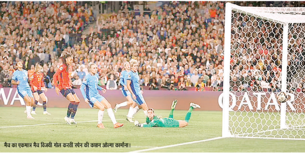
मैच का एकमात्र मैच विजयी गोल करती स्पेन की कप्तान ओल्गा कार्मोना।