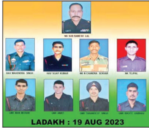
LADAKH : 19 AUG 2023