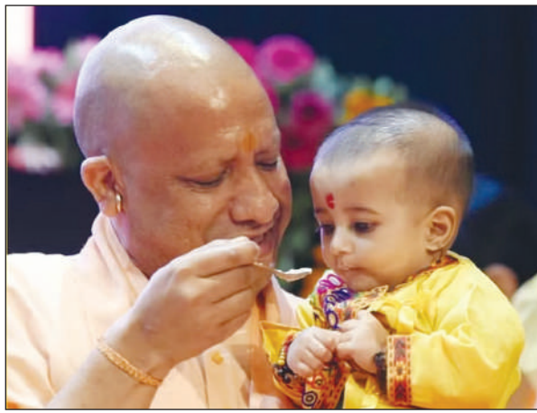
और डीबीटी के माध्यम से आंगनवाड़ी कार्यकर्ताओं के खाते में 29 करोड़ की राशि हस्तांतरित की। उन्होंने अपने भाषण में कहा कि यह पोषण माह की छठवीं वर्षगांठ है। कुपोषण का परिणाम

लखनऊ। मुख्यमंत्री योगी आदित्यनाथ ने कहा कि आंगनवाड़ी कार्यकर्ताओं की भूमिका मां यशोदा की तरह है क्योंकि उन्हें मां यशोदा की तरह बच्चों का पालन-पोषण करना होता है। मुख्यमंत्री योगी आदित्यनाथ ने मंगलवार को लखनऊ में 'राष्ट्रीय पोषण माह' के अंतर्गत 1,359 आंगनवाड़ी केंद्रों और 171 बाल विकास परियोजना कार्यालयों के लोकार्पण व शिलान्यास और आंगनवाड़ी कार्यकर्ताओं को युनिफॉर्म हेतु धनराशि अंतरण के कार्यक्रम में बोल रहे थे। इस मौके पर उन्होंने कुपोषित से सुपोषित श्रेणी में आने वाले बच्चों के अभिभावकों को सम्मानित किया