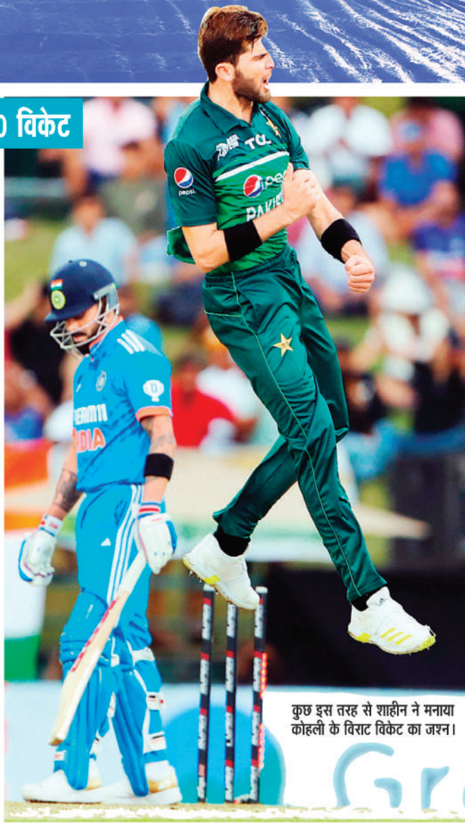
कुछ इस तरह से शाहीन ने मनाया कोहली के विराट विकेट का जश्न।