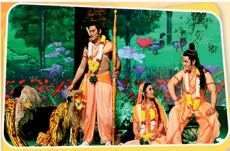
लवकुश रामलीला, दिल्ली

सर्वादा पुरुषोत्तम भगवान श्रीराम भारतीय संस्कृति की पहचान हैं। श्रीराम की कथा-लीलाओं को मंचित होते देखने का आनंद लोग सदियों से लेते आ रहे हैं। यही वजह है कि शारदीय नवरात्र आरंभ होते ही हर तरफ रामलीलाओं की गूंज सुनाई देने लगती है। आज के दौर में लोगों की दिलचस्पी अब वृहद स्तर पर होने वाली भव्य रामलीलाओं में ज्यादा होने लगी है। इन रामलीलाओं में अब सेट डिजाइनिंग से लेकर साउंड, लाइट और तकनीक हर चीज में ऐसे बदलाव होने लगे हैं, जो दर्शकों को रोमांच से भर देते हैं। फिल्म और टीवी कलाकार भी इन रामलीलाओं में भाग लेते हैं। इस साल भी देश में कई स्थानों पर वृहद स्तर पर रामलीलाओं का मंचन हो रहा है तो पारंपरिक तरीके से चली आ रही कई छोटी रामलीलाएं भी आयोजित की जा रही हैं।