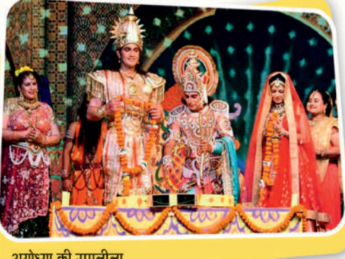
अयोध्या की रामलीला