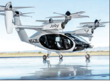
इंटरग्लोब एंटरप्राइजेज की योजना 2026 में पूरे देश में एक पूर्ण-इलेक्ट्रिक एयर टैक्सी सेवा शुरू करने की है। वह यह सेवा आर्चर एविएशन के साथ मिलकर शुरू करने की योजना बना रही है। एक बयान में कहा गया है कि इसके साथ ही इंटरग्लोब-आर्चर उड़ान का लक्ष्य यात्रियों को राष्ट्रीय राजधानी के कर्नाट प्लेस से हरियाणा के गुरुग्राम तक करीब सात मिनट में ले जाने का है। सड़क मार्ग से इस 27 किलोमीटर की यात्रा में एक से डेढ़ घंटे का समय लगता है। दोनों कंपनियों ने भारत में एक पूर्ण-इलेक्ट्रिक एयर टैक्सी सेवा शुरू करने व उसके

परिचालन के लिए एक समझौता ज्ञापन (एमओयू) पर हस्ताक्षर किए हैं। हालांकि, इसके लिए अभी नियामकीय मंजूरी ली जानी है। इंटरग्लोब एंटरप्राइजेज एक भारतीय यात्रा समूह है और देश की सबसे बड़ी एयरलाइन इंडियो इसका हिस्सा है। आर्चर एविएशन इलेक्ट्रिक वर्टिकल टेकऑफ और लैंडिंग (ईवीटीओएल) विमान क्षेत्र में अग्रणी है। दोनों कंपनियों का इरादा देश में पूर्ण-इलेक्ट्रिक टैक्सी सेवा 2026 में शुरू करने का है।