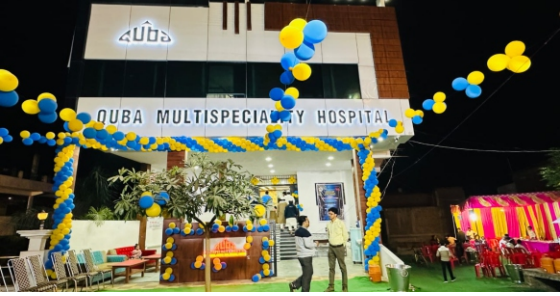
कूबा मल्टीस्पेशलिटी हॉस्पिटल का हुआ उद्घाटन

प्रखर पूर्वांचल वाराणसी। आज की इस भागदौड़ की दुनिया में स्वास्थ्य पर बेहतर नियंत्रण रखना एक चुनौती के बराबर है। खान पान के अनियमितता के कारण भी