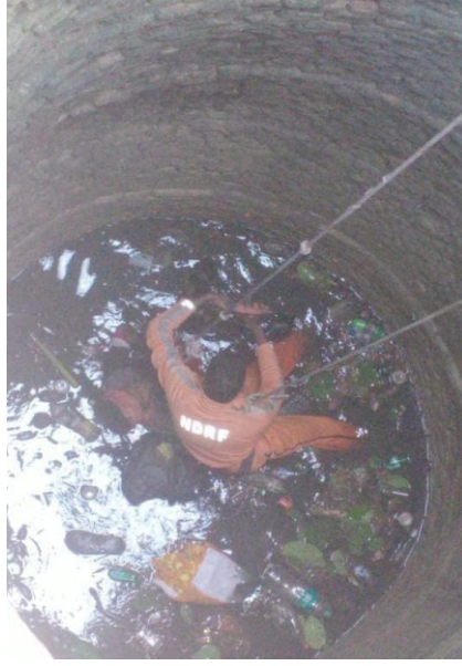
प्रखर पूर्वांचल वाराणसी। चोलापुर थाना अन्तर्गत ग्राम कटारी में 50 फीट गहरे कुएं में एक व्यक्ति गिर गया था जिसे निकालने के लिए दूसरा व्यक्ति