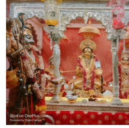
अन्नकूट देखने देश विदेश से पहुंचे भक्त, माता अन्नपूर्णा कच्चा-पक्का अन्न से 511 कुंतल से लगा 56 भोग