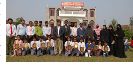
प्रखर खेतासराय जौनपुर। बाल दिवस पर कई शिक्षा संस्थानों में मंगलवार को कार्यक्रम आयोजित कर चाचा नेहरू को याद किया गया।

प्रखर खेतासराय जौनपुर। बाल दिवस पर कई शिक्षा संस्थानों में मंगलवार को कार्यक्रम आयोजित कर चाचा नेहरू को याद किया गया। विभिन्न स्कूलों में देश के प्रथम प्रधानमंत्री पंडित जवाहर लाल नेहरू का भावपूर्ण स्मरण किया गया। स्कूलों में बाल मेला सहित रंगारंग कार्यक्रम व खेलकूद