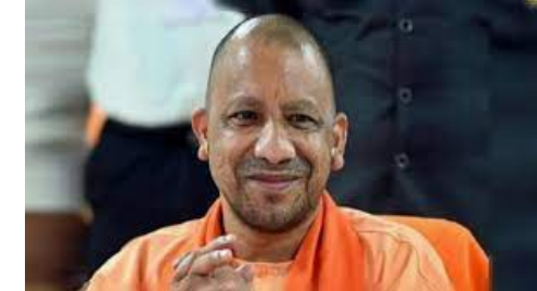
वाराणसी के 50 उद्यमी होंगे शामिल

प्रखर एजेंसी। इंडियन इंडस्ट्रीज एसोसिएशन की ओर से 30 नवंबर को लखनऊ में उद्यमी महासम्मेलन का उद्घाटन मुख्यमंत्री योगी आदित्यनाथ करेंगे। विभूति खंड स्थित इंदिरा गांधी प्रतिष्ठान में उद्यमी महासम्मेलन में ट्रांसफॉर्मिंग एमएसएमई 4.0 पर चर्चा होगी। उद्यमियों को उद्योग की स्थापना व संचालन में आ रही समस्याओं से मुख्यमंत्री को अवगत कराया जाएगा। वाराणसी के 50 से ज्यादा उद्यमी सम्मेलन में शामिल होंगे। विशिष्ट अतिथि औद्योगिक विकास निर्यात प्रोत्साहन व निवेश प्रोत्साहन