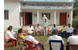
प्रखर ब्यूरो गाजीपुर। शुक्रवार को उत्तर प्रदेश पंचायती राज