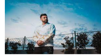
गिप्पी ग्रेवाल के कनाडा स्थित बंगले पर फायरिंग

प्रखर एजेंसी। पंजाबी सिंगर गिप्पी ग्रेवाल को लेकर बड़ी खबर सामने आई है। मीडिया रिपोर्ट्स के अनुसार गिप्पी ग्रेवाल के बंगले पर फायरिंग हुई है। वहीं, लॉरेंस बिश्नोई गैंग ने पंजाबी सिंगर गिप्पी ग्रेवाल के बंगले पर फायरिंग का दावा किया है। बता दें कि लॉरेंस बिश्नोई गैंग की तरफ से सोशल मीडिया पर पोस्ट साझा कर इस फायरिंग का दावा किया गया है। बता दें कि गिप्पी