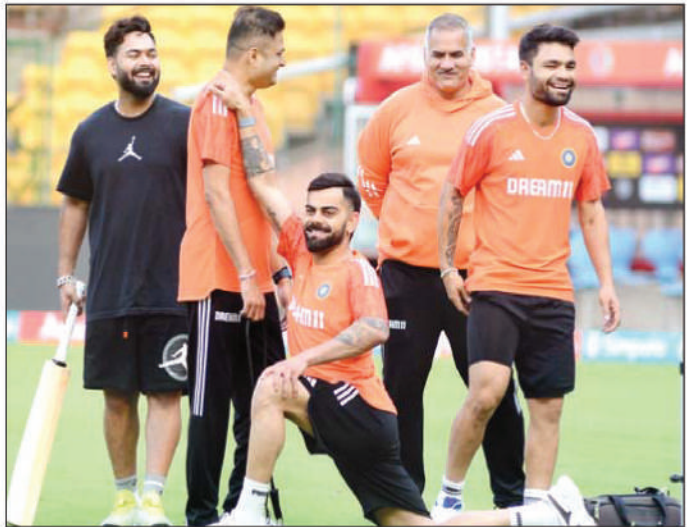
बेंगलुरु: अभ्यास सत्र के दौरान वार्मअप करते विराट कोहली साथ में हैं ऋषभ पंत।

करीब 14 महीने बाद पहला टी-20 खेल रहे कोहली ने इंदौर में 16 गेंद में 29 रन बनाए। उन्होंने अफगानिस्तान के स्पिनर मुजीबुर रहमान का बखूबी सामना किया और उनकी सात गेंदों में 18 रन बनाए।