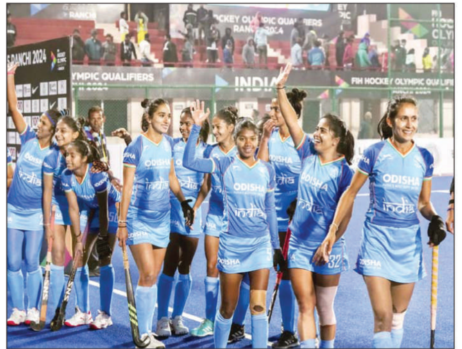
रांची: इटली पर जीत दर्ज कर सेमीफाइनल में जगह पक्की करने पर दर्शकों का अभिवादन करती भारतीय खिलाड़ी।