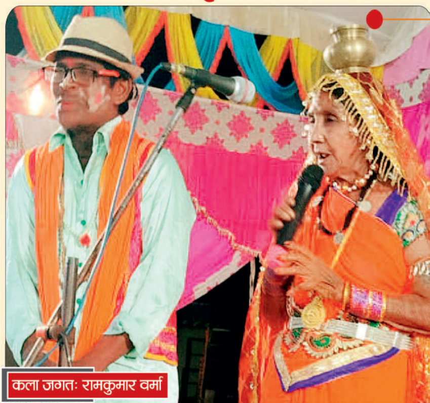
कला जगत: रामकुमार वर्मा