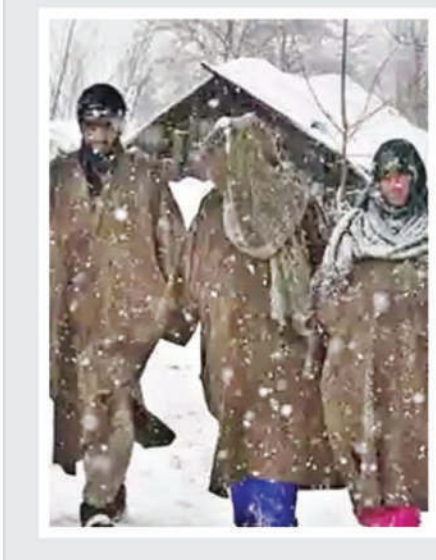
श्रीनगर (भाषा)। कश्मीर में शीत लहर के बीच कई हिस्सों में न्यूनतम तापमान जमाव बिंदु से कई डिग्री नीचे गिर गया। अधिकारियों ने मंगलवार को यह जानकारी दी। अधिकारियों बताया कि श्रीनगर शहर में सोमवार रात तापमान शून्य से 4.6 डिग्री सेल्सियस नीचे दर्ज किया गया जो इससे एक रात पहले शून्य से 4.3 डिग्री सेल्सियस नीचे था। काजीगुंड में तापमान शून्य से 4.4 डिग्री सेल्सियस नीचे दर्ज किया गया, जबकि उत्तरी कश्मीर के गुलमर्ग में तापमान शून्य से 3.1 डिग्री सेल्सियस नीचे दर्ज किया गया। दक्षिण कश्मीर के अनंतनाग जिले के पहलगाम में न्यूनतम तापमान शून्य से 5.4 डिग्री

सेल्सियस नीचे दर्ज किया गया। कोकरनाग शहर में न्यूनतम तापमान शून्य से नीचे 2.3 डिग्री सेल्सियस नीचे और कुपवाड़ा में शून्य से 4.1 डिग्री नीचे सेल्सियस दर्ज किया गया। अधिकारियों ने बताया कि कश्मीर में मौसम शूफ है और बर्फबारी नहीं होने से रात में कड़के की सर्दी पड़ रही है जबकि दिन सेल्सियस नीचे था। श्रीनगर में दिन का तापमान साल के इस समय के सामान्य से आठ डिग्री अधिक है। कश्मीर में वर्तमान में 40 दिनों की कठोर सर्दियों की अवधि 'चिल्लई-कला' जारी है। इन दिनों क्षेत्र में शीत लहर चलती है और तापमान बेहद नीचे चला जाता है, जिससे जल निकासों के