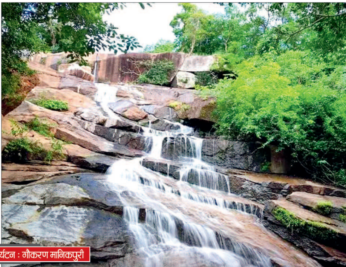
पर्यटन: गौकरण मानिकपुरी

छत्तीसगढ़ के गरियाबंद जिले में भी प्राकृतिक नैसर्गिक सौंदर्य के अनेक स्थल देखे जाते हैं। इस जिले के अनेक स्थानों में वर्ष भर पर्यटक प्रकृति का आनंद लेने पहुंचते रहते हैं। इन्हीं में महत्वपूर्ण पर्यटन स्थल के रूप में घड़घड़ी जलप्रपात भी शामिल हो गया है। लगभग 120 फीट ऊंचाई से गिरता यह अंचल का सबसे बड़ा जलप्रपात है। ऊंची-ऊंची चट्टानों के बीच घड़-घड़ आवाज से गिरता जलप्रपात पर्यटकों के मन को प्रफुल्लित कर देता है। जल के गिरने पर घड़-घड़ ध्वनि के कारण इस जलप्रपात का नाम घड़घड़ी रखा गया है।