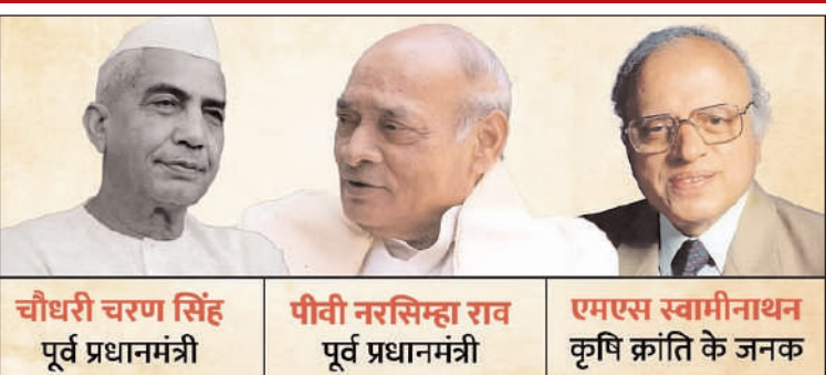
चौधरी चरण सिंह पूर्व प्रधानमंत्री

नई दिल्ली। केंद्र सरकार ने पूर्व प्रधानमंत्री चौधरी चरण सिंह और पीवी नरसिम्हा राव को सर्वोच्च नागरिक सम्मान 'भारत रत्न' देने का एलान किया है। वैज्ञानिक एमएस स्वामीनाथन को भी भारत रत्न देने का एलान किया गया है। प्रधानमंत्री नरेंद्र मोदी 'एक्स' पर इसका एलान किया। प्रधानमंत्री मोदी एक के बाद एक तीन दृष्टिकोण कर के तीनों हस्तियों के बारे में लिखते हुए उन्हें यह सम्मान देने की घोषणा की। इससे पहले बिहार के पूर्व मुख्यमंत्री कर्पूरी ठाकुर और देश के पूर्व उप-प्रधानमंत्री लालकृष्ण आणवाणी को भी यह सम्मान देने का एलान हो चुका है। आडवाणी को छोड़कर बाकी चारों हस्तियों को मरणोपरांत यह सम्मान दिया जाएगा।