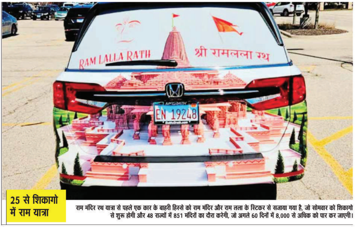
25 से शिकागो में राम यात्रा राम मंदिर रथ यात्रा से पहले एक कार के बाहरी हिस्से को राम मंदिर और राम लला के स्टिकर से सजाया गया है, जो सोमवार को शिकागो से शुरू होगी और 48 राज्यों में 851 मंदिरों का दौरा करेगी, जो अगले 60 दिनों में 8,000 से अधिक को पार कर जाएगी।

मुंबई। बॉलीवुड अभिनेता शाहिद कपूर सिल्वर स्क्रीन पर छत्रपति शिवाजी महाराज का किरदार निभाते नजर आ सकते हैं। हाल ही में घोषणा की गई थी कि पूजा एंटरटेनमेंट के बैनर तले बन रही फिल्म 'अश्वत्थामा' का किरदार निभाते नजर आयेगे। इस बीच शाहिद कपूर की अगली फिल्म को लेकर बड़ा अपडेट सामने आ गया है। चर्चा है कि फिल्म ओह माय गॉड 2 (ओएमजी 2) के निर्देशक अमित राय एक नई फिल्म बनाने की योजना कर रहे हैं, जिसमें शाहिद कपूर लीड रोल में दिखने वाले हैं। यह फिल्म छत्रपति शिवाजी महाराज के जीवन से प्रेरित होगी। इस फिल्म में शाहिद कपूर वीर योद्धा छत्रपति शिवाजी महाराज की भूमिका में नजर सकते हैं। इससे पहले शाहिद कपूर फिल्मकार संजय लीला भंसाली की फिल्म पद्मावत में महाराजा रतन सिंह के किरदार में नजर आ चुके हैं।