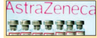
■ उपलब्ध टीकों की अधिक संख्या को बताया वजह

एस्ट्राजेनेका ने सीएम इंस्टिट्यूट ऑफ इंडिया (एसआईआई) के साथ मिलकर भारत को कोविशिल्ड टीकों की आपूर्ति की थी। एस्ट्राजेनेका ने कोरोना टीके विकसित करने के लिए ऑक्सफोर्ड विश्वविद्यालय के साथ साझेदारी की थी। इन टीकों को भारत में कोविशिल्ड और यूरोप में 'वैक्सजेविया' के नाम से बेचा गया था।