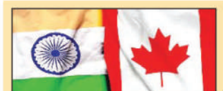
■ मामले को लेकर भारत-कनाडा में राजनयिक तनाव

यान्गून । म्यांमार पुलिस ने पूर्वी म्यांमार के शान प्रांत में 15 लाख नशीली गोलियां जव की हैं। सेंट्रल कमेटी फॉर ड्रग एव्यूज कंट्रोल (सीसीडीएसी) की ओर से जारी बयान के अनुसार खुफिया जानकारी के आधार पर छेड़े गए अभियान के दौरान पुलिस ने नॉन्कियो टाउनशिप में एक ट्रक को रोका और तलाशी ली। ट्रक में भारी मात्रा में रखी गयी नशीली गोलियां जव की। मौके से भागने के लिए प्रयासरत ट्रक चालक को पुलिस ने गिरफ्तार कर लिया, लेकिन ट्रक नवांथकिओ-यारसीक रोड के पास एक खड्ड में दुर्घटनाग्रस्त हो गया। जव दवाओं की कीमत लगभग 75 करोड़ क्यट है। शुरुआती जांच में पता चला है कि नशीली दवाइयों को शां प्रांत से मॉडल ले जाया जा रहा था।